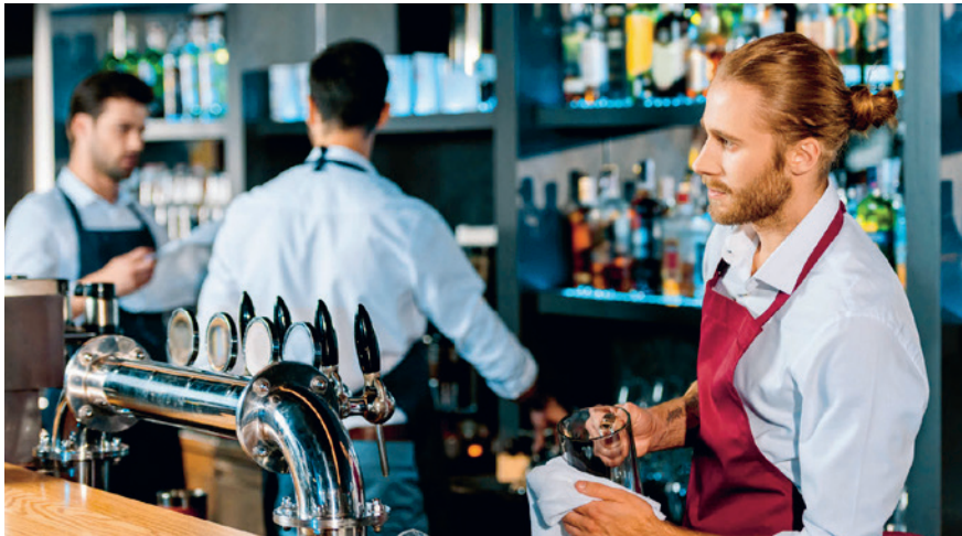
Der individuelle Anspruch auf bezahlte Feiertage hängt vom Anstellungsverhältnis ab.

Bei Teilzeitmitarbeitenden mit festen Arbeitstagen ist die Situation relativ einfach: Fällt ein Feiertag auf einen ihrer regulären Arbeitstage, haben sie frei und erhalten ihren normalen Lohn. Komplizierter wird es bei flexiblen Arbeitstagen. Hier empfiehlt sich eine anteilmässige Berechnung des Feiertagsanspruchs. Beispiel: Ein 50%-Mitarbeiter hätte bei 10 Feiertagen pro Jahr Anspruch auf 5 bezahlte Feiertage. Diese können dann flexibel zugeteilt oder als Zeitguthaben verrechnet werden.